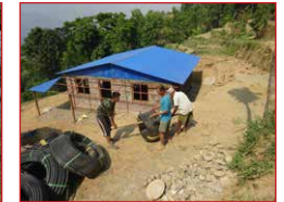
Das erste Modellhaus ist fast fertig – erdbebensicher