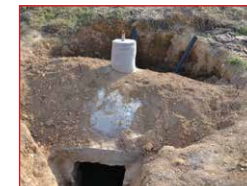
Biogasanlagen sorgen für saubere Energie

Die Nutzung von Dung, Mist und Fäkalien wird den Gebrauch von Kunstdünger ersetzen, zusätzlich wird die Bevölkerung in der Umsetzung ökologischer Landwirtschaft unterstützt. Jeder Haushalt soll seine eigene Biogasanlage erhalten, um den Holzverbrauch zu minimieren und saubere Energie zu produzieren. Der Einsatz von künstlichem Dünger und Pflanzenschutzmitteln soll gestoppt werden.