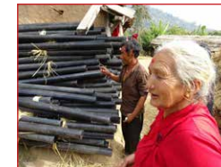
Material zur Wasserversorgung

Um notwendige Ernten für das Dorf sicherzustellen, wurden zwischen März und Juli 2016 tausende Meter Kunststoffleitungen von der Wasserquelle zu den einzelnen Äckern verlegt. Zudem erhielten 75 Haushalte erstmalig Trinkwasser an ihr Grundstück. Der Verein finanzierte das komplette Material von Ihren Spendengeldern, die Dorfbewohner verrichteten allen notwendigen Arbeiten.