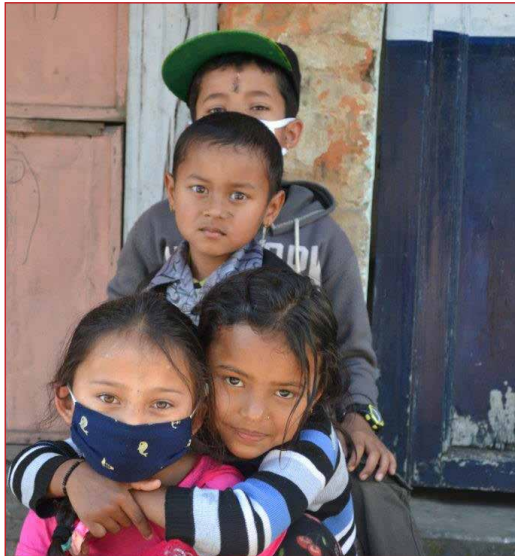
Besonders die Kinder sind auf Hilfe angewiesen. Sie haben fast alles verloren.