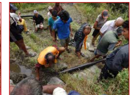
Dorfbewohner verlegen die neuen Wasserleitungen