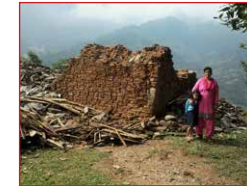
Mutter und Tochter stehen vor ihrem zerstörten Haus

Mit den vorhandenen Materialien wollen die Dorfbewohner ihre Häuser in traditioneller Bauweise wiederaufbauen. Das Besondere: Jedes Haus ist danach erdbebensicher und bietet einen entsprechenden Schutz. Ein „Modellhaus“ ist bereits mit sicherem Fundament, Wände und Dach fertiggestellt worden.