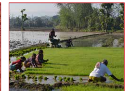
Ökologische Landwirtschaft für gesunde Erträge